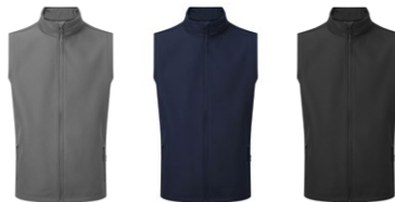
156 Mørk grå