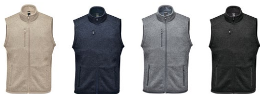
525 Sandmelert 385 Marinemelert 165 Karbon 199 Sortmelert