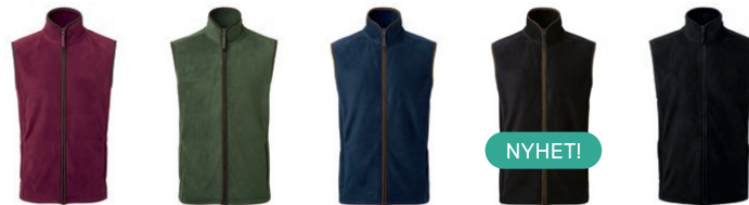
280 Vinrød/brun 480 Flaskegrønn/brun 380 Marine/brun 951 Sort/brun 199 Sort/sort